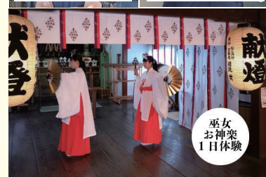
巫女 お神楽 1日体験