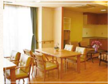
落ち着いた共同生活室

全室個室で、トイレ・洗面所を完備。ご家族のご訪問時も、ゆっくりとくつろいでいただけます。