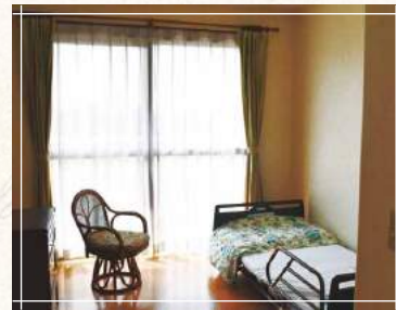
ゆったりくつろげる個室

ご入居いただき、日常生活全般をサポート。10名のグループ単位によるユニットケア方式で、個人を尊重しつつ、家庭的なふれあいの場も確保しています。